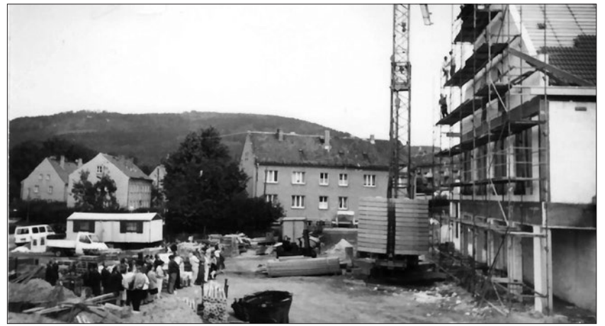
Im Februar 1993 war es soweit. An der Czornebohstraße öffnete das Geschäftshaus, das Foto stammt vom Richtfest im Herbst 1992.

(Februar) Geschäftshaus an der Czornebohstraße eröffnet, mit Einkaufszentrum, Sparkasse und Drogeriemarkt.