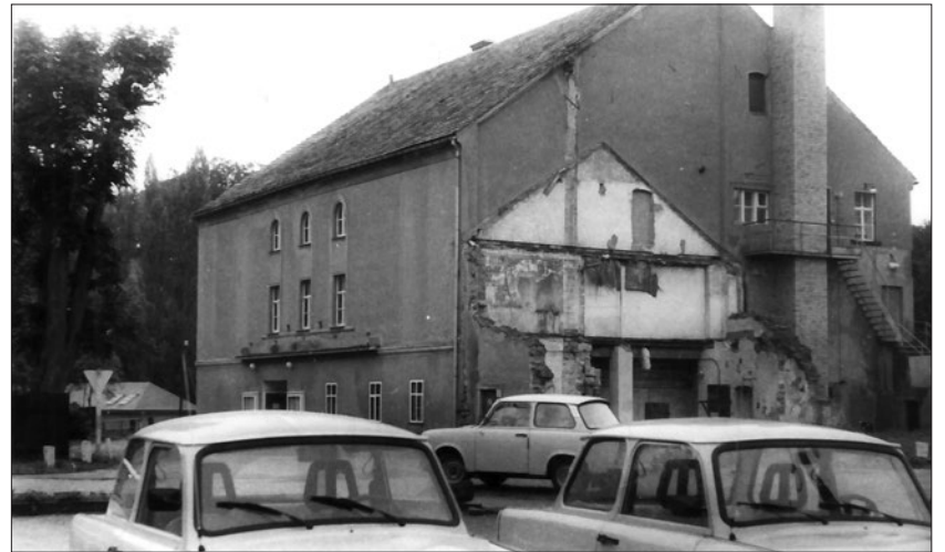
Oktober 1998 – vor 25 Jahren wurde das ehemalige Kino an der Wolfsschlucht abgerissen. Es war nicht zu retten.