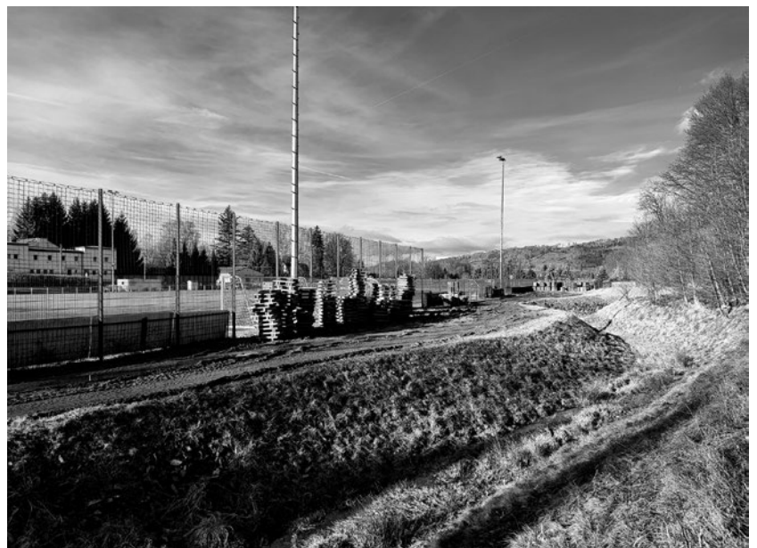
Zwischen Fußballplatz und dem Eichberg musste das Betonpflaster für den Bierweg zwischengelagert werden.