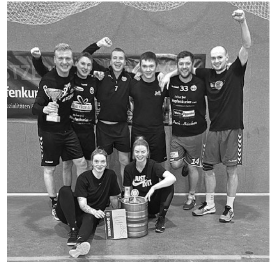
Die Sieger des Völkerball-Turniers lassen sich feiern!

Es war eine sensationelle Veranstaltung am 30. Dezember in der Cunewalder Polenzsporthalle. 21 Teilnehmermannschaften spielten in einem super organisierten Turnier um den Siegerpokal – und noch viel wichtiger – für einen guten Zweck. Dieses Mal wurde im Rahmen des Turniers für die Mukoviszidose-Stiftung gesammelt. Das aus dem Schulsport bekannte Spiel erfreute sich dabei großer Beliebtheit. Letztlich mussten sogar noch Teams abgesagt werden, da die Kapazitätsgrenze erreicht war. Erfreulich, dass das Turnier auch zahlreiche Teams aus der Ferne aber auch viele Teilnehmer aus unserem Ort zum freundlichen miteinander zwischen den Feiertagen vereinte. Der Sieg ging dieses Jahr an den TSV Socolahora – einer Mannschaft die dennoch größtenteils aus Cunewalder Handballern bestand. Platz 2 ging ebenfalls an ein