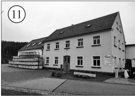
Auch dieses alte Foto bereitete einigen Kopfzerbrechen. Am äußeren Erscheinungsbild hat sich gar nicht so viel verändert. Wir sehen die Gebäude der Firma Graf in Schönberg.