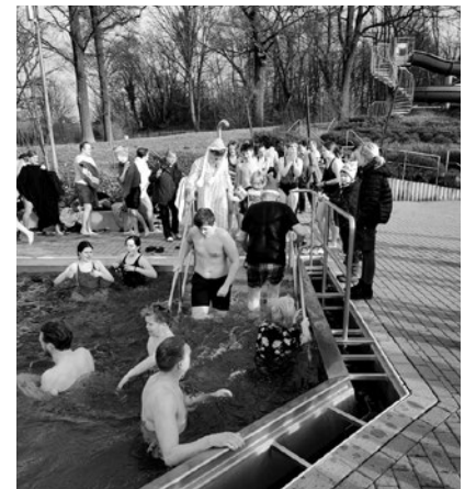
Kalt-nasser Jahresstart im Erlebnisbad! Mehr zum Neujahrsschwimmen auf Seite 21.

Auflösung und Gewinner Weihnachtsbilderrätsel