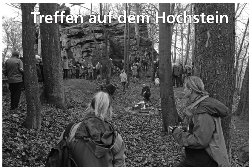
Der Hochstein war am 1. Januar Ziel vieler Wanderfreunde. Zu ihrem ersten Treffen 2023 kamen rund 300 Wanderer auf den Gipfel. Es wurden nicht nur Neujahrswünsche ausgetauscht sondern auch Pläne für Wandertouren geschmiedet.

Nähere Auskünfte zu diesen und weiteren Terminen erhalten Sie bei der Tourist-Information Cunewalde (Tel. 035877 80888). Tourist-Information