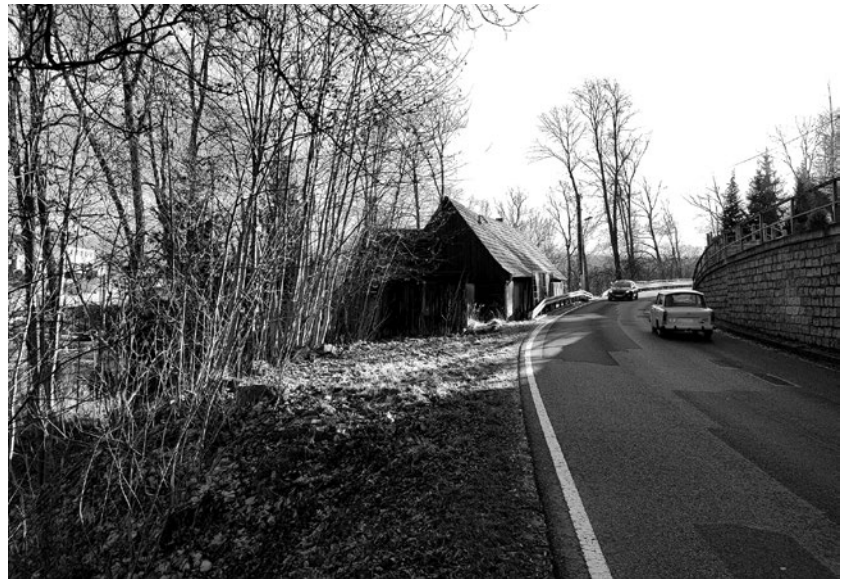
Das marode Häuschen Oberlausitzer Straße 30 wird in Kürze abgerissen, die Sperrung der Straße ist nicht erforderlich.