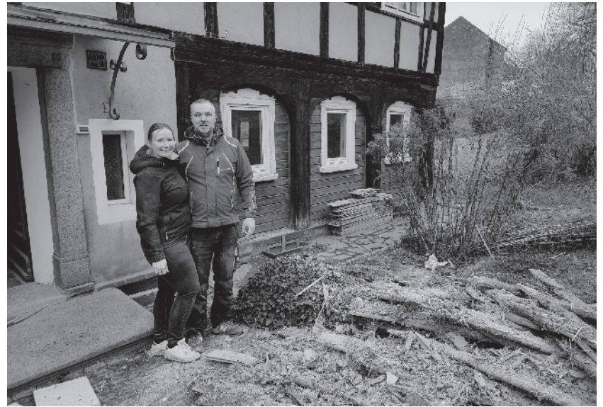
Schönes Beispiel: Nach dem Kauf des Umgebendehauses Am Bahndamm 9 sind die neuen Eigentümer fleißig mit dem Um- und Ausbau beschäftigt.

jedes Objekt informiert werden. Fakt ist, dass sich der durchaus sehr zeitintensive und somit auch personalintensive Einsatz der Gemeindeverwaltung und des im Gemeindeamt befindlichen kommunalen Sanierungsträger der CTI GmbH durchaus lohnt – denn viele Anwesen haben eine gute Entwicklung genommen. Rein rechtlich stellt das Brachflächen- und Quartiermanagement der Gemeinde jedoch eine freiwillige Leistung da. Mit der Dezemberausgabe haben wir die Serie vorerst beendet und möchten heute nochmals – in Anlehnung an die – sicherlich auch interpretationsbedürftige Benotung einzelner Fußballer nach ihren Fußballspielen – eine Bewertung der zurückliegenden Serien vornehmen und einen kleinen Ausblick wagen. Thomas Martolock, Bürgermeister