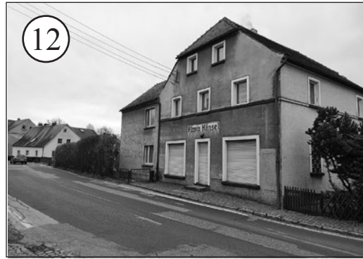
Die offensichtlich leichteste Hürde des gesamten Rätsels. Zu sehen ist die ehemalige Drogerie Hänsel im Oberdorf nach dem Abriss des alten eingeschossigen Hauses, das parallel zur Hauptstraße stand.