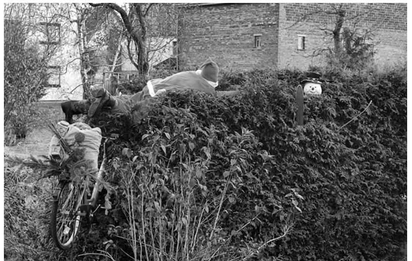
Der hier am Radweg „verunfallte“ Weihnachtsmann hat wohl doch noch für volle Gabentische sorgen können.

Verein der Obercunewalder Feuerwehrtradition e. V.