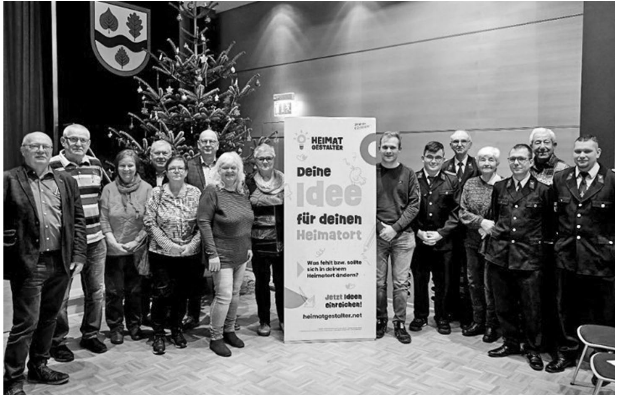
Allein 12 der insgesamt 38 ausgezeichneten Projekte stammten aus Cunewalder Initiativen von Vereinen und Privatpersonen.

Lesen Sie dazu bitte ausführlich auf den Seiten 10 und 11!