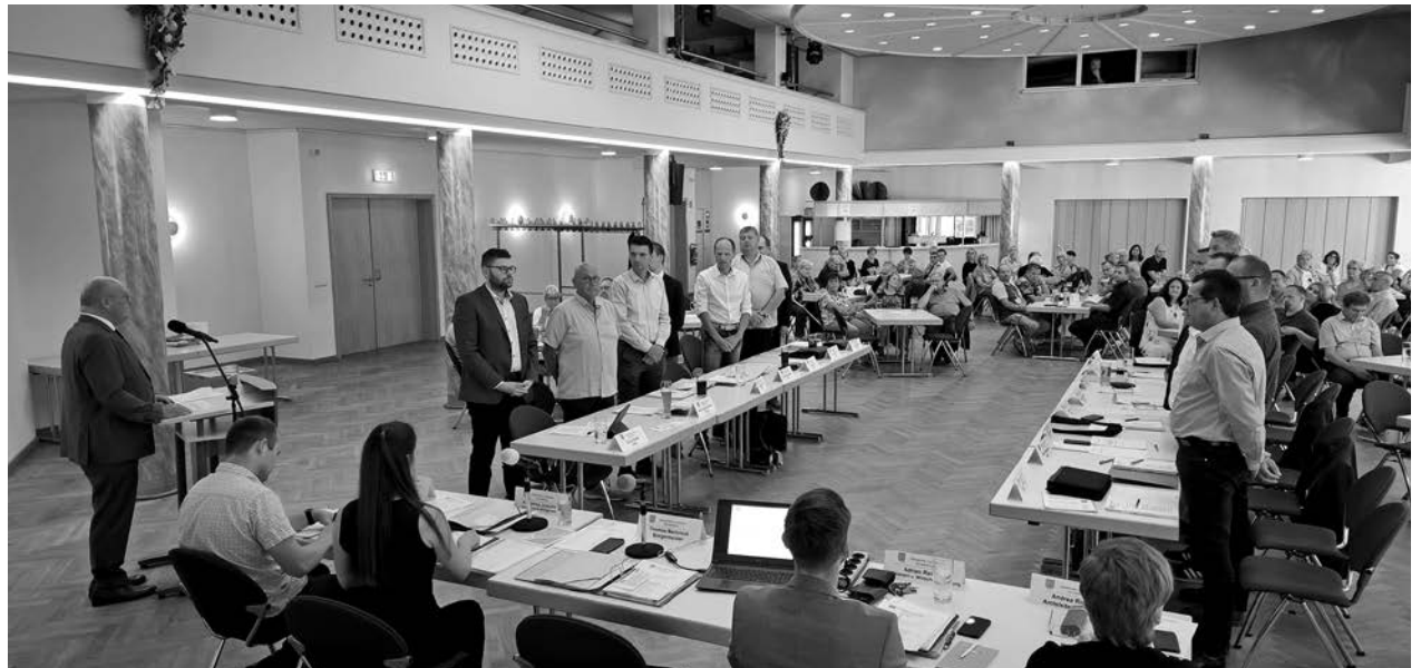
Bürgermeister Thomas Martolock vereidigte den Gemeinderat unter Verwendung der vorgeschriebenen Formel.