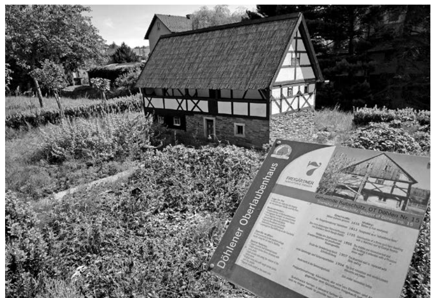
Im Umgebindehaus-Park wartet das Döhlener Oberlaubenhaus als nächstes auf seine Erneuerung.

Als nächstes Objekt hat sich das Kleinunternehmen Wildbau Forker dem Döhlener Oberlaubenhaus zugewandt. Auch hier sind negative Überraschungen hinsichtlich des Schadbildes nicht ausgeschlossen. Es ist zu befürchten, dass Schäden zutage treten, die von außen nicht sichtbar sind. M. Hempel