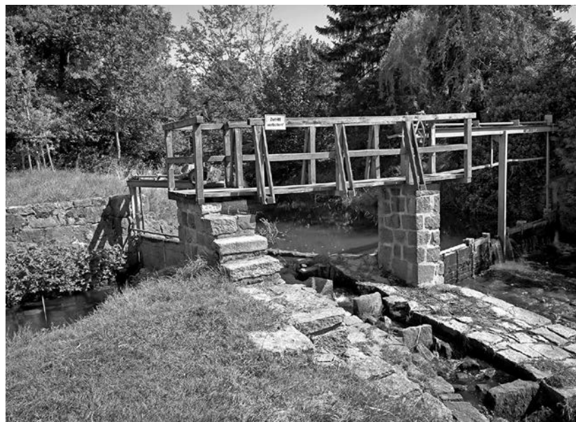
Die alte Wehranlage am Umgebindehaus-Park wird grundhaft saniert, viele Teile sind verschlissen.

Das Vorhaben hat ein Gesamtvolumen von etwa 17.000 €, hiervon fließen rund 12.500 € als Förderung aus dem genannten Programm des Freistaates Sachsen zur Finanzierung des Vorhabens ein. M. Hempel