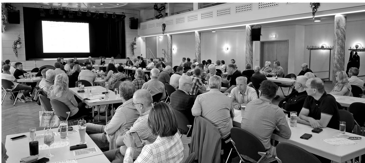
Etwa 80 Gäste, darunter auch ehemalige Ratsmitglieder, wohnten der konstituierenden Sitzung bei.

Der Immobilienmarkt in Cunewalde hatte sich gut entwickelt und es waren aufgrund gestiegener Nachfrage bessere Preise erzielbar. In kurzer Zeit hatten wir 10 Bauplatzanfragen für das Wohngebiet an der Friedensauwe noch bevor wir mit der Erschließung begonnen