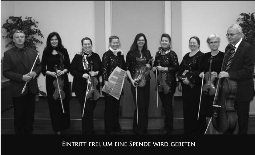
EINTRITT FREI, UM EINE SPENDE WIRD GEBETEN