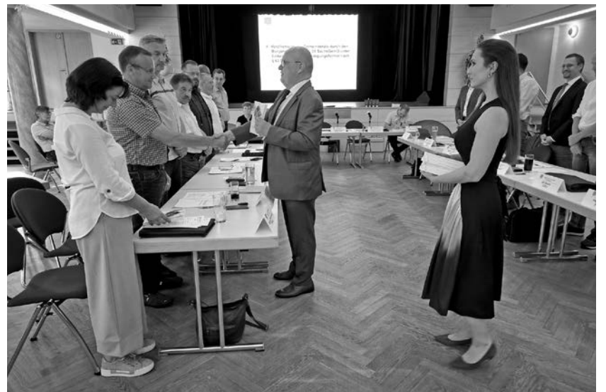
Nach der Vereidigungsformel folgte zur Bekräftigung der jeweils persönlichen Handschlag mit jedem Mitglied des Gemeinderates.