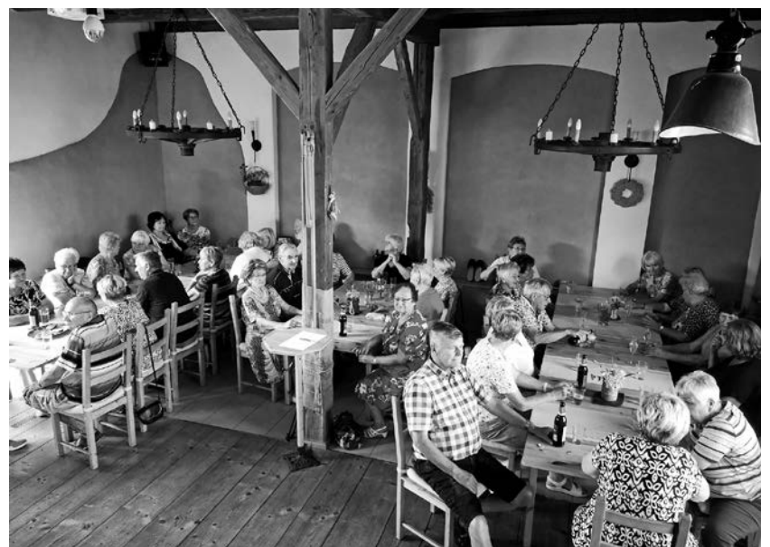
Wieder war das Senioren-Café gut besucht. Das sollte sich herumsprechen!

Die Wehrleitung der Freiwilligen Feuerwehr Cunewalde