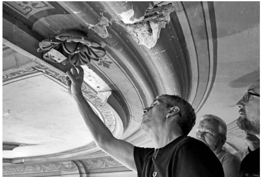
Noch stehen die Gutachten aus, doch selbst für Laien wurde bei der Besichtigung klar, dass an der Kirchendecke dringender Handlungsbedarf besteht.

26. Oktober, 9 Uhr – Baumpflanzaktion im Kirchenwald mit Förster Schaller, Treffpunkt wieder am Schönberger Sportplatz.