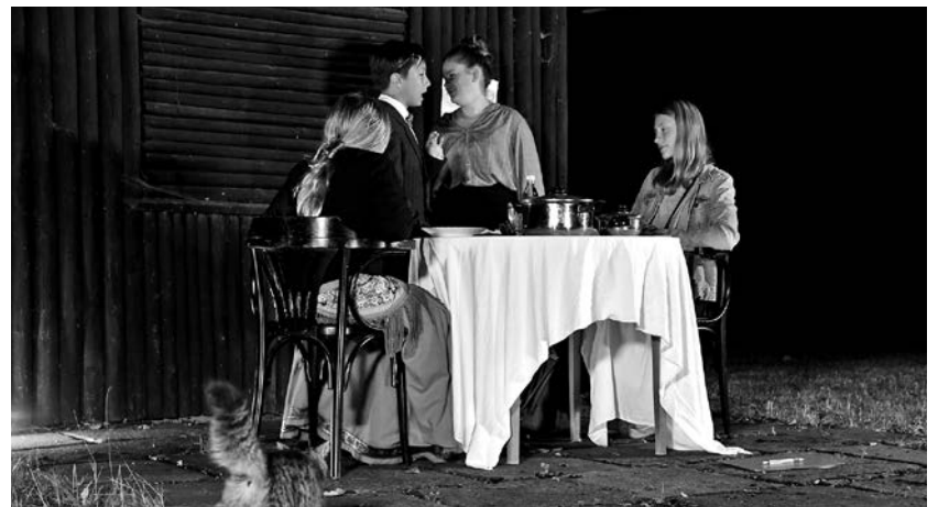
Wer's gerne ein bisschen schaurig mag: Im September spukt es wieder im Polenzpark. Gehen Sie doch mal hin!