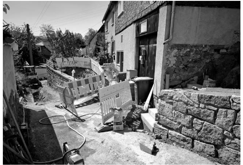
Auf der Baustelle an der Rabinke geht es ziemlich beengt zu. Die Arbeiten an den Stützmauern sind bereits so gut wie abgeschlossen.

Die Gesamtkosten liegen bei 14.500 Euro. Bei der Förderhöhe von 80 Prozent beträgt der Zuschuss 11.500 Euro. M. Hempel