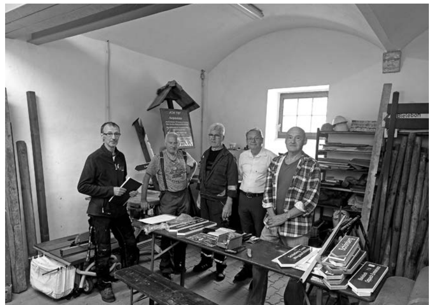
Regelmäßig montags treffen sich die Wanderwegewarte in der gut eingerichteten Werkstatt im ehemaligen Oberen Hof.