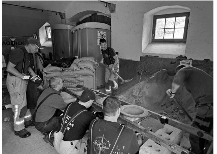
Freiwillige der Feuerwehr waren unermüdlich dabei, um Sandsäcke zu füllen. Danke an alle ehrenamtlichen Helfer!