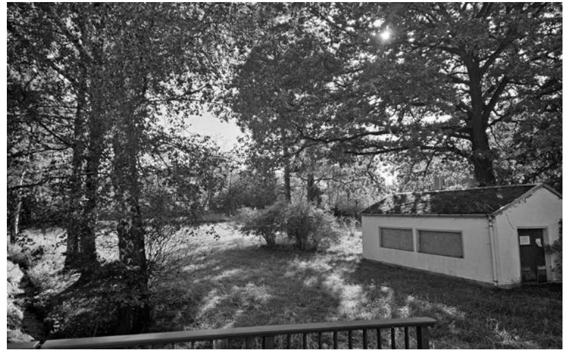
Das Grundstück hinter der ehemaligen Wäschrolle an der Neudorfstraße steht zum Verkauf.

Das Mindestgebot für die Fläche beträgt: 21.775,00 €