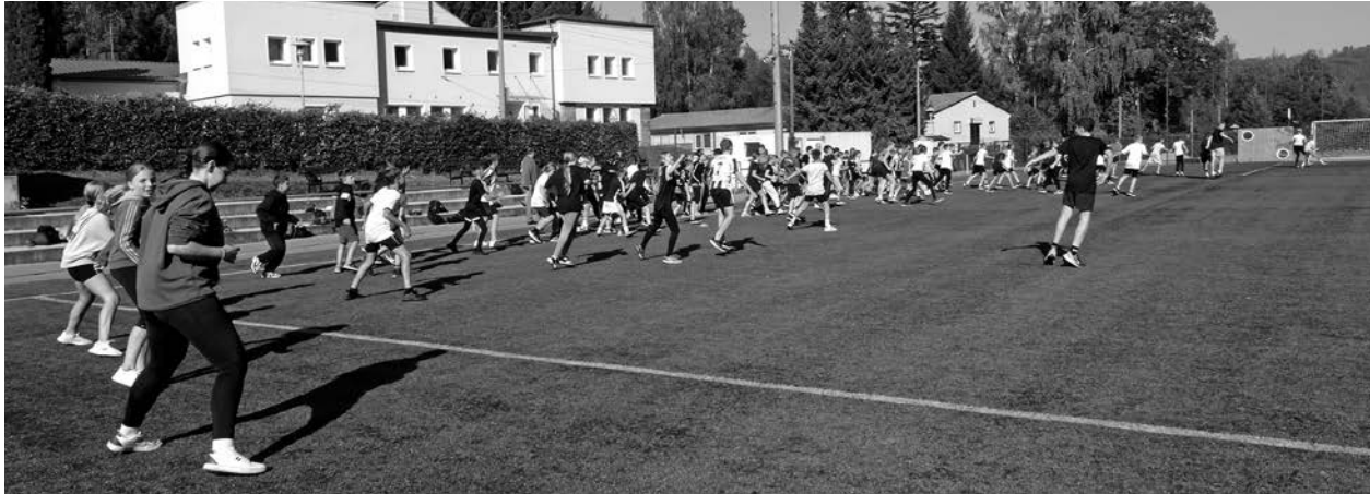
Im Rahmen des Sportfestes wurden 80 neue Sportabzeichen verliehen und damit die Leistungen der Schüler gewürdigt.

Ein herzlicher Dank gilt allen Beteiligten, die zum Gelingen dieses Sporttages beigetragen haben, insbesondere der SG Motor Cunewalde (Abteilung Fußball), dem Kreissportbund Bautzen sowie der Gemeinde Cunewalde, die die Öffnung des Bades ermöglichte. Die große Unterstützung durch das Badpersonal war eine große Hilfe bei der Absicherung der Schwimmprüfung. Vergessen möchten wir nicht die Bäckerei Pech, welches unsere sportlichste Klasse mit einem leckeren Blechkuchen belohnte. Vielen lieben Dank dafür.