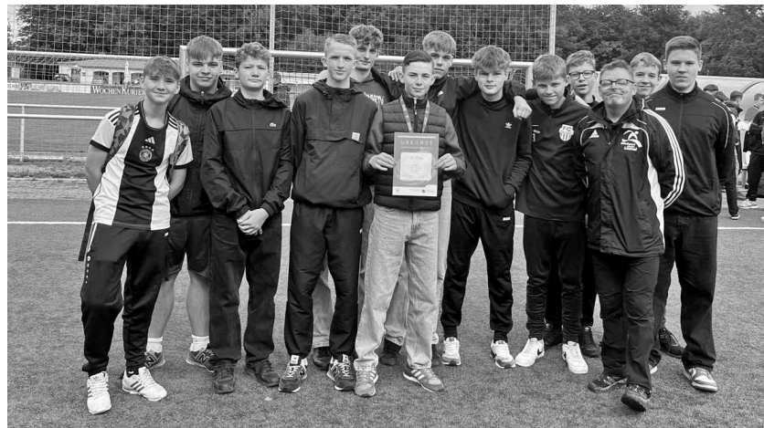
Sie vertraten die Polenz-Oberschule hervorragend, obwohl ihnen im Halbfinale und im Spiel um Platz 3 die Nerven versagten.

Elisabeth Herold Schulsozialarbeit Oberschule Cunewalde Valtenbergwichtel e.V.