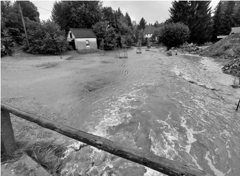
Land unter in Klipphausen! Die Elze hat ihr schmales Bachbett verlassen. Glücklicherweise hielten sich die Schäden in Grenzen.