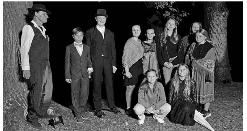
Großes Kino im Polenzpark! Vor herrlicher Kulisse führte die Theatergruppe der Polenz-Oberschule Teil 3 des Spuks auf.