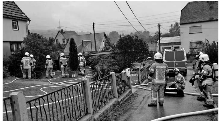
Das Brandereignis an der Neudorfstraße war geprägt von starker Rauchentwicklung, wodurch die Einsatzkräfte nur unter Atemschutz agieren konnten.

Aus unbekannter Ursache war es im Keller zum Brand von Heizmaterial und gelagerten Gegenständen gekommen. Sofort wurde ein Innenangriff unter Atemschutz eingeleitet. Das eigentliche Feuer war schnell gelöscht, zumal