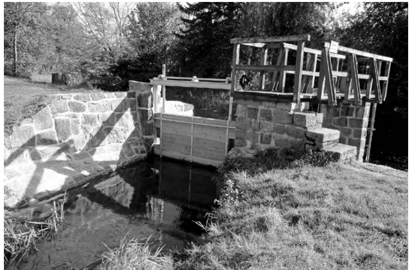
Die Wehranlage ist noch nicht ganz fertig, die Abschiebung zum Trutzmühlteich ist aber schon eingebaut.