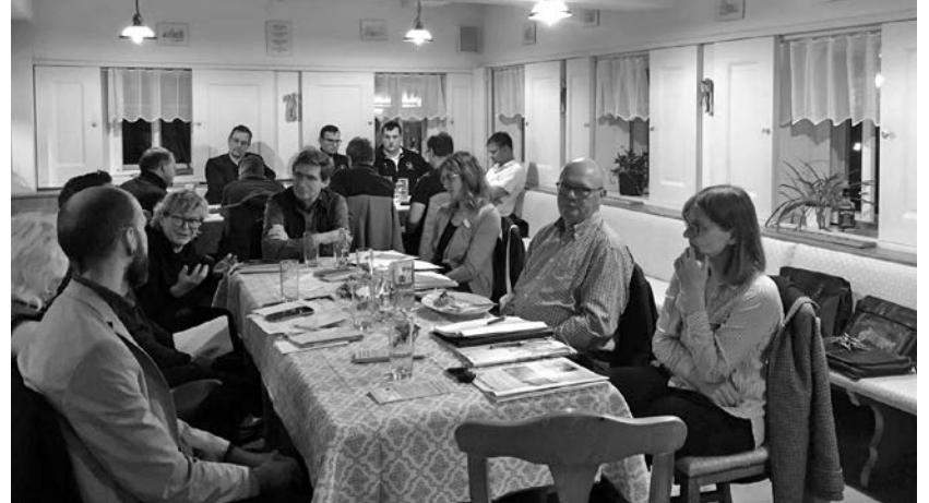
Die Versammlung der Vereinsvorsitzenden im „Alten Weber“ war sehr gut besucht und gute Gelegenheit zum Austausch wichtiger Informationen.