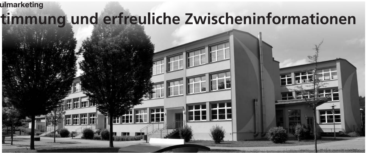
Die Wilhelm-von-Polenz-Oberschule Cunewalde ist eine der modernsten im Landkreis Bautzen.

Herr Szewczyk hatte auch Informationen zum bisher alles andere als zufriedenstellenden Arbeitsstand für die Brandschadensbeseitigung an der Polenz-Sporthalle mit im Gepäck. Er äußerte großes Verständnis für den zunehmenden Unmut von Bürgerschaft und insbesondere der Eltern aktueller,