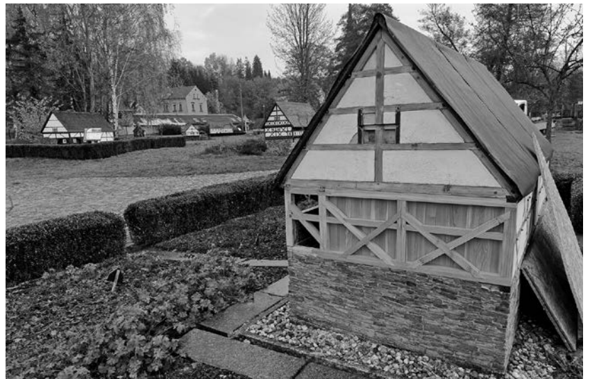
Das „Döhlener Oberlaubenhaus“ war dringend sanierungsbedürftig, die Schäden verbargen sich im Inneren.