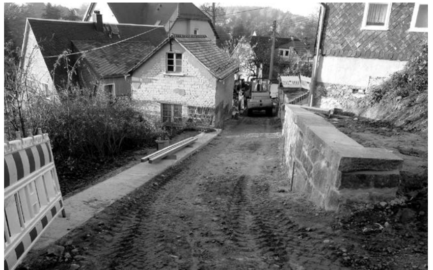
Das Vorhaben in der Rabinke geht langsam aber sicher seinem Abschluss entgegen.