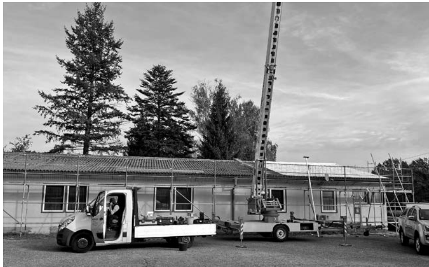
Das nicht mehr dichte Dach der Kegelbahn wurde mit Planen abgedeckt.