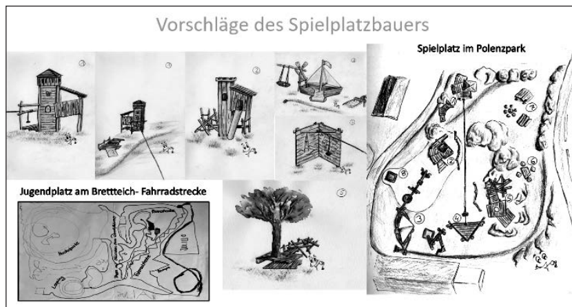
Der hinzugezogene Spielplatzbauer hat bereits mehrere Gestaltungsvorschläge für die weitere Vorplanung vorgelegt.

Wenn Sie helfen und mitmachen wollen, sprechen Sie uns bitte an!